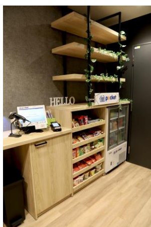
無人セルフコンビニ MINI STOP pocket