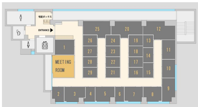
『ハローオフィス池袋』配置図

今回ご紹介した『ハローオフィス池袋』の空室状況や個室ごとの料金、くわしい設備などはハローオフィス公式ホームページよりご確認ください。