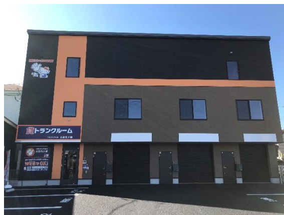
ハロービズストレージ 大宮市見沼区丸ヶ崎

「ハロービズストレージ」は、専用駐車場・事務所・倉庫がワンパッケージとなった事業者向け賃貸物件です。多くの用途に利用いただけるスペース、機能が揃っているため、それぞれを別々に探して契約する手間を省くことができるうえに、賃料を圧縮することが可能なので、起業や独立を検討している方の新たな事業拠点としても最適な物件です。