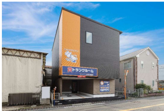
ハローストレージ茨木学園南町

エリアリンク株式会社（本社：東京都千代田区、代表取締役：鈴木貴佳、以下、エリアリンク）は、不動産特定共同事業法に基づく不動産小口化商品「ハローAct（アクト）」を提供しています。この度、第5号物件となる大阪府茨木市学園南町にある「ハローストレージ 茨木学園南町」は、7月16日に募集を開始後、多くの問い合わせをいただき8月30日に組成が完了しました。