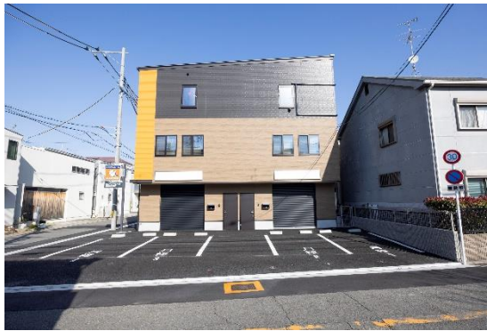
ハロービズストレージ 藤井寺北條町

日本最大級のレンタルトラックルーム「ハローストレージ」を運営するエリアリンク株式会社（本社：東京都千代田区、代表取締役：鈴木貴佳 以下、エリアリンク）は、法人向けの賃貸物件「ハロービズストレージ藤井寺北條町」を12月16日（月）にオープンいたします。「ハロービズストレージ」では、関西エリアでは2件目となります。